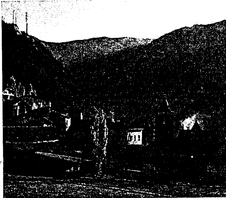
Una imatge del Pirineu català.

En general, per tal de consolidar i potenciar la presència de pagesos i ramaders en el territori, el DARP està desenvolupant les següents actuacions: formació dels professionals agraris i ramaders, assistència tècnica, inversió en recerca i investigació, i mesures de suport a l'activitat agrària i ramadera. Amb això es vol assegurar el relleu generacional al medi rural i garantir un sector dinàmic i competitiu.