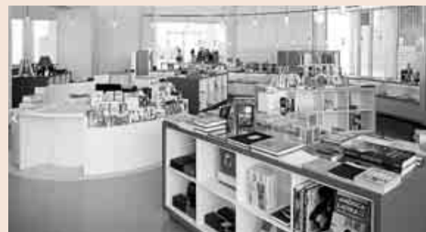
Interior de la Macba Store Laie's, en el edificio Meier de Barcelona.

lacionados con las exposiciones y actividades del Macba. Además, ofrece en exclusiva merchandising inspirado en las obras y artistas de la colección del museo, así como piezas de diseñadores vinculados al barrio del Raval. El Macba Store Laie's pretende ser un referente en nuevas tendencias, y tiene como objetivo convertirse en dinamizador cultural del museo.