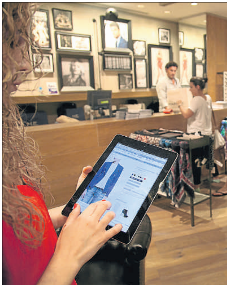
Compra on line desde la tienda física, el modelo de Mango

La encuesta se enmarca en la estrategia del Govern de impulsar el comercio electrónico entre los comerciantes locales. "Creemos que el comercio on line es un aliado y complemento para las tiendas físicas, y que el sector catalán tiene una gran oportuni-