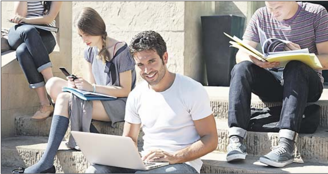
El Gobierno ha acordado aumentar la partida destinada a los estudiantes que estén ya en el extranjero. EE

Polonia y Portugal, países comparables por tamaño a España, han mejorado sus resultados por una mayor autonomía de los centros educativos y porque tienen mecanismos de rendición de cuentas.