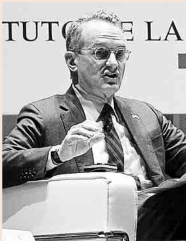
Howard Marks, presidente de Oaktree Capital.

La empresa necesita un acuerdo laboral para evitar el concurso de acreedores