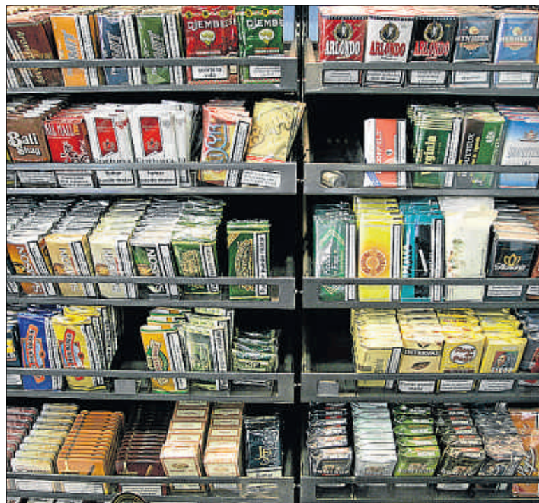
Las subidas de impuestos han disparado las ventas de tabaco de liar

El impuesto que grava las bebidas espirituosas pasará de 8,30 euros por litro de alcohol puro a 9,13 euros por litro, lo que supone 83 céntimos más. Dicha subida tendrá impacto únicamente en los destilados, ya que, según apuntó el ministro en la rueda de prensa posterior al Consejo de Ministros del viernes, esta medida "no afectará ni al vino ni a la cerveza". Desde el punto de vista de la salud, sin embargo, es difícil sostener que el alcohol del vino o la cerveza es menos nocivo que el de los destilados (normalmen-