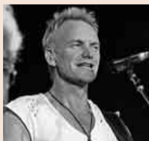
El cantante Sting.