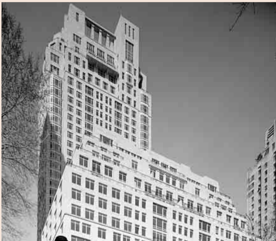
Fachada del edificio 15 Central Park West.

Otras celebridades no extendieron cheques por cantidades tan altas. Pero sus nom-