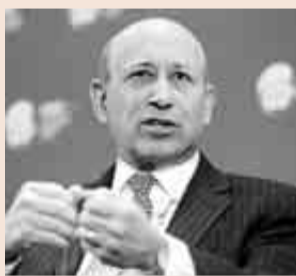
Lloyd Blankfein, consejero delegado de Goldman Sachs.