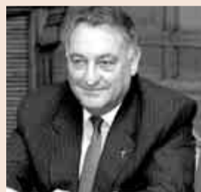
Sandy Weill, expresidente de Citi.