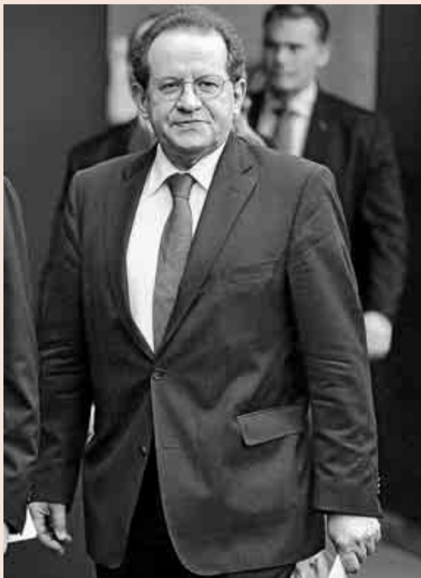
Victor Constancio, vicepresidente del BCE.

Según los datos del BCE, en Europa hay casi 600 millones de billetes de 500 euros en circulación, con un valor aproximado de 300.000 millones de euros. España cuenta con más de 90 millones de billetes en circulación (en torno a 45.000 millones de euros). Pero el propio BCE reconoce que sólo un tercio de esos billetes se utilizan con fines transaccionales. Por su parte, la Agencia Británica