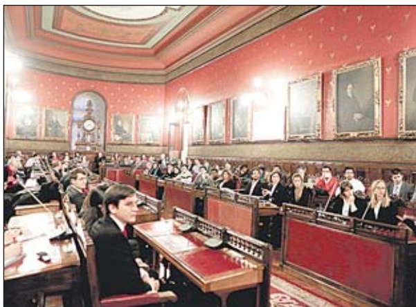
Foto de los asistentes a la ceremonia durante la celebración en la antigua sala de cotizaciones de la Bolsa de Madrid.