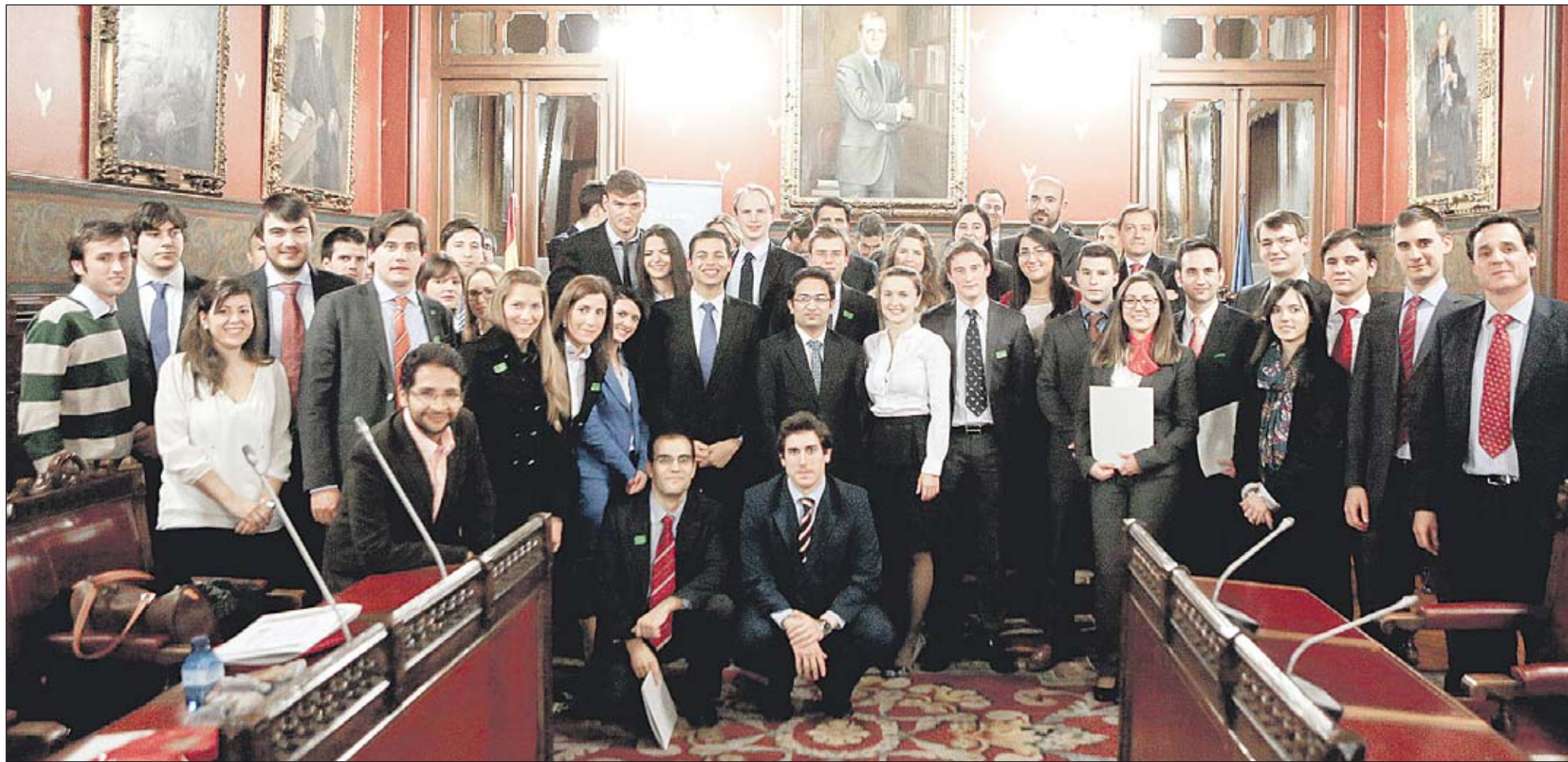
Foto de todos los alumnos participantes en la fase final del concurso CFA Spain tras la entrega de premios en uno de los salones del edificio de la Bolsa de Madrid.