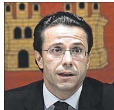
Javier Fernández-Lasquetty. EFE

El consejero insistió en que el Gobierno regional asumirá como propias todas aquellas medidas alternativas que resulten "concretas y con cuantía suficiente" para ahorrar los 533 millones de euros que tienen este año menos de presupuesto, algo que, a su juicio, no consiguen las propuestas elaboradas por los sindicatos de profesionales.