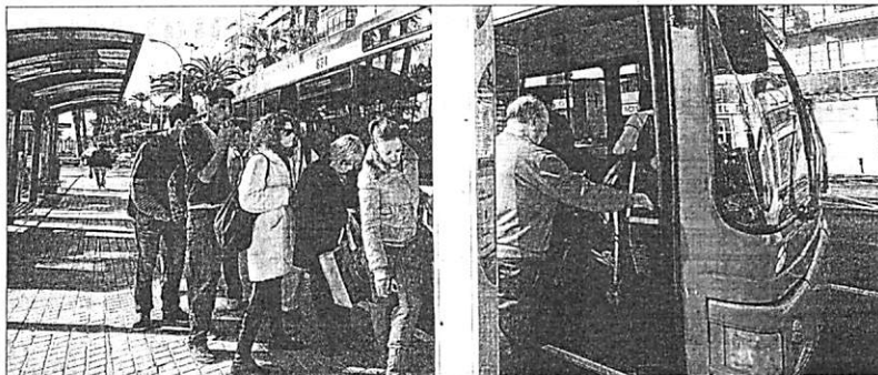
Imagen de un autobús del transporte público en el centro de la ciudad. PILAR CORTÉS

La oferta, las condiciones de uso y protección de datos están disponibles en la dirección cuponismo.diarioinformacion.com