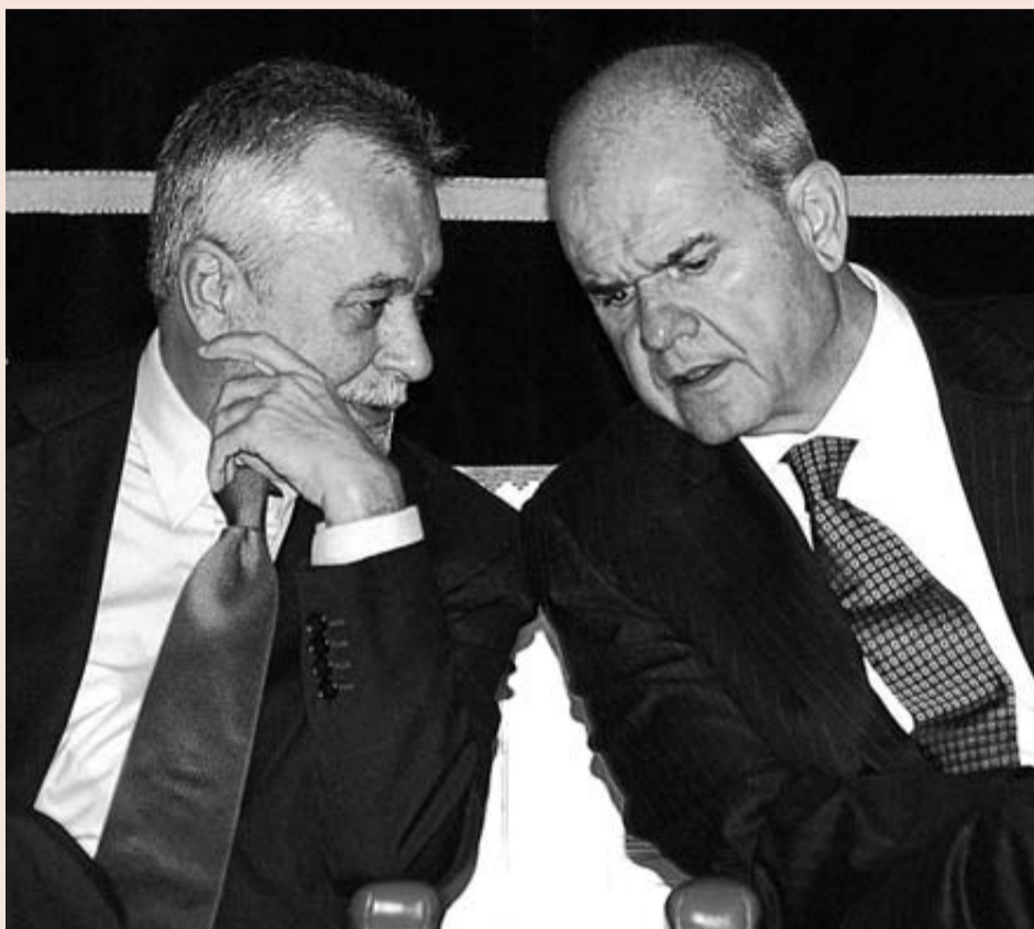
El presidente de Andalucía, José Antonio Griñán, y el vicepresidente territorial, Manuel Chaves.

El nuevo gravamen se incluye dentro en el plan regional de reducción del déficit público