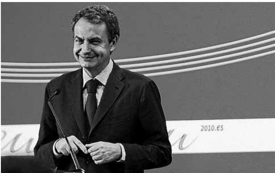
José Luis Rodríguez Zapatero anuncia la subida de impuestos el pasado miércoles.