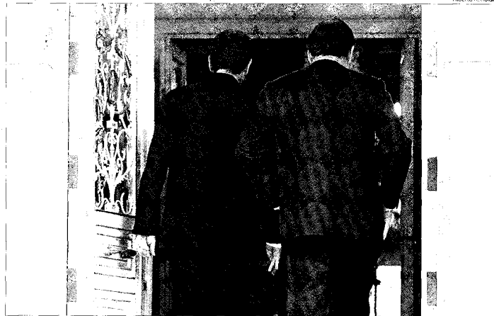
La lentitud en la ordenación de las cajas y las autonomías pueden dar al traste con el acuerdo Zapatero-Rajoy

El texto de la Lorca permite a los ejecutivos autonómicos vetar las uniones de sus cajas. El fin de este privilegio y la conversión del Banco de España en el último órgano