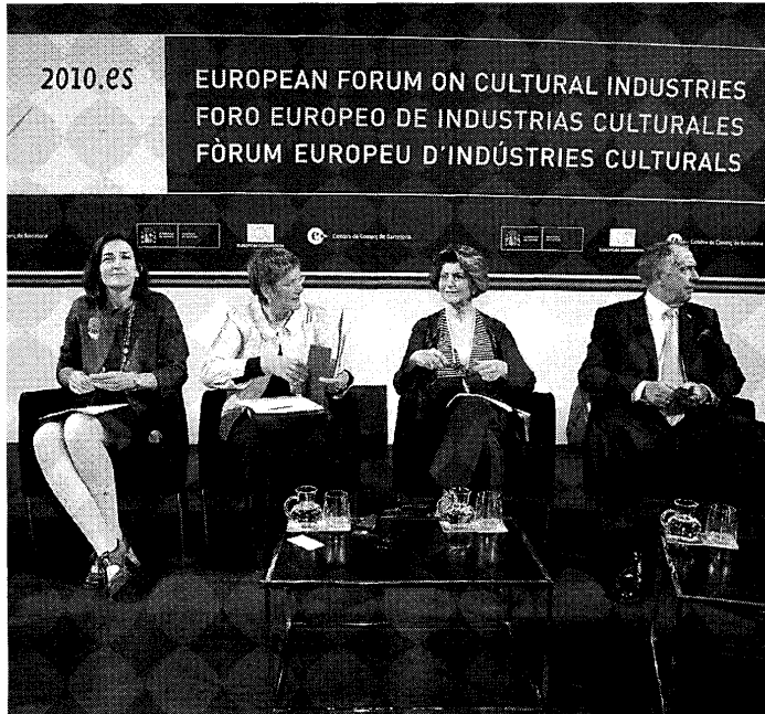
A l'esquerra, la intervenció que va clausurar el fòrum, ahir a la tarda; i a la dreta, un acte de protesta que es va fer al migdia.

El ministre alemany va lamentar també que Europa encara no es creu prou que la cultura és un motor de creixement important, i va criticar que no s'hagin inclòs les indústries culturals i creatives en la nova