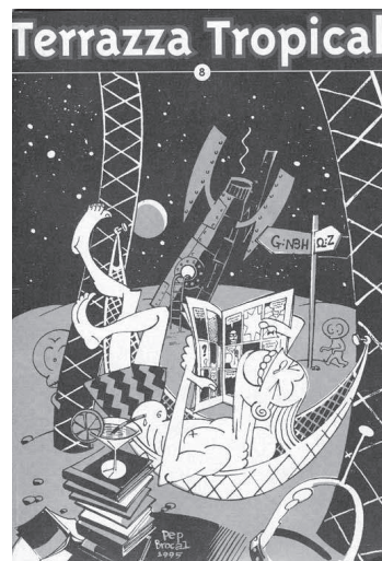
Terrazza Tropical, núm. 8 (1995).