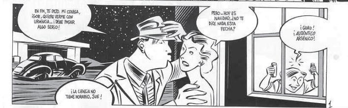
Página inicial de uno de los capítulos de "¡Hola, terrícola!" (1989).