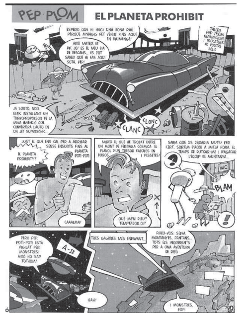
Una página de "Pep Plom" (1995).