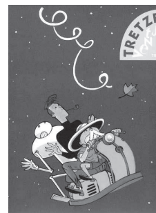
Tretzevents, núm. 722.