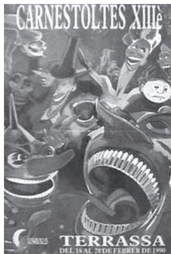
Cartel del Carnestoltes de 1990.