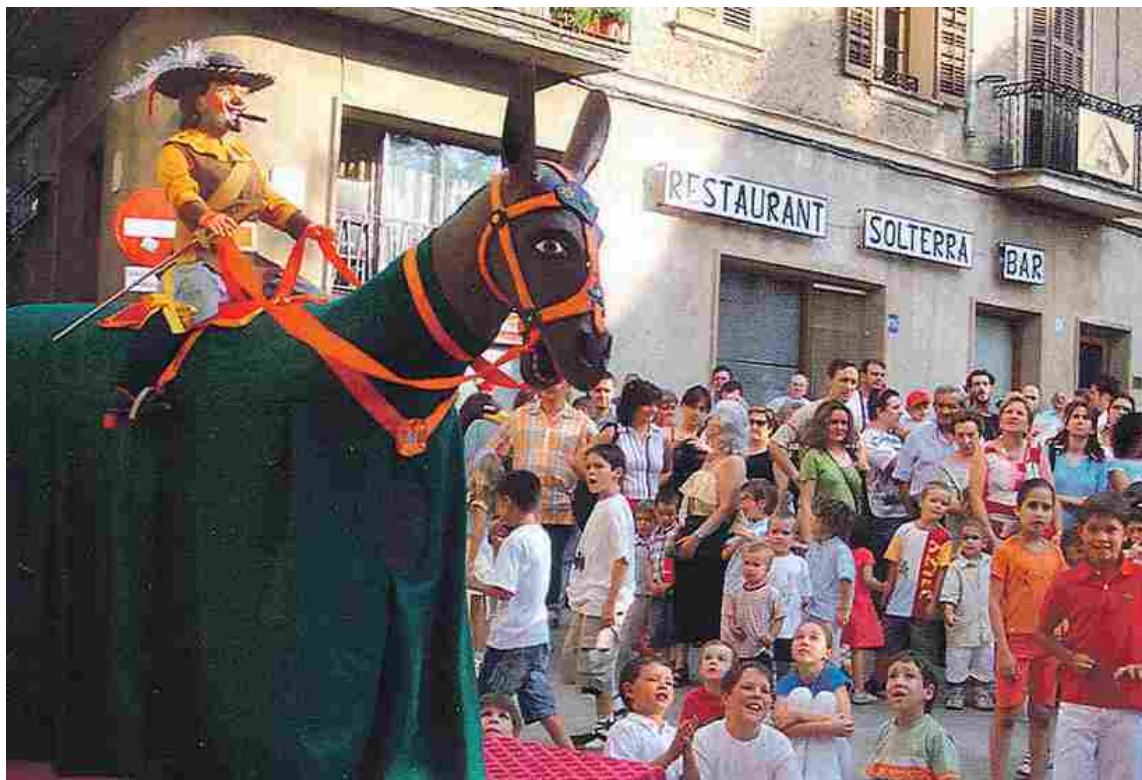
La Mulassa, uno de los elementos de la cultura tradicional y popular más característicos de la fiesta mayor de Solsona

Esta semana he pasado tres días en Solsona, en fiestas, confortablemente alojado en el hotel Sant Roc, una preciosidad modernista, inaugurado en 1929. Era la primera vez que pisaba las calles de Solsona y eso para un Sagarreta como yo es algo imperdonable. Debía haberlas pisado mucho antes y, de manera especial, la plaza de Sant Joan, en cuya fuente hay una placa con un célebre poema de mi padre: Record de Solsona . Ese poema lo debió de escribir mi padre siendo un muchacho, en 1911 o 1912, cuando visitó Solsona probablemente invitado por el doctor Josep Falp i Plana, al que conoció en el Ateneu, un hombre de la Renaixença, difusor de las tesis higienistas y vegetarianas, autor de una Topografía médica de Solsona y comarca (1901), y que además de curar a las personas hacía versos. La casa de los Falp estaba, y sigue estando, en el número 12 de la plaza de Sant Joan. "Fa una lluna clara i una nit serena./ Jo m'estic a la plaça de Sant Joan;/ damunt les finestres cau la lluna plena./ cau damunt la pica que la fa brillant". Así comienza el poema de mi padre. Y termina así: "Jo no sé pas per què jo aquí voldria/ estar-hi llarga estona quietament./ amb una noia sols per companyia/ sense basar-la ni dir-li cap lament./ Veure el tresor que d'aquí estant s'obira/ sense esflora-li el seu cabell gentil,/ o sols sentir-la a la vora com respira.../ I respirar aquest aire tan tranquil".