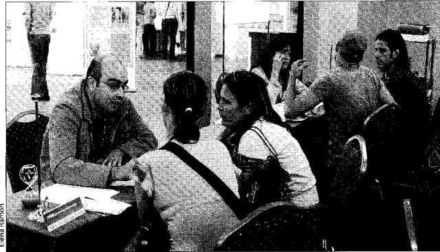
Barcelona Activa prevé asesorar a 650 personas en las jornadas del Día de l'Emprendedor.

Pese a que Catalunya es la comunidad autónoma con menos riesgo a emprender, sigue existiendo una cultura de miedo al fracaso que es mucho menor en otros países como Estados Unidos. La Asociación de Jóvenes Emprendedores sugiere que este temor debe mitigarse impulsando la cultura emprendedora desde la escuela. "Entrar en contacto con otras culturas como la anglosajona también ayuda a comprender que el fracaso puede ser