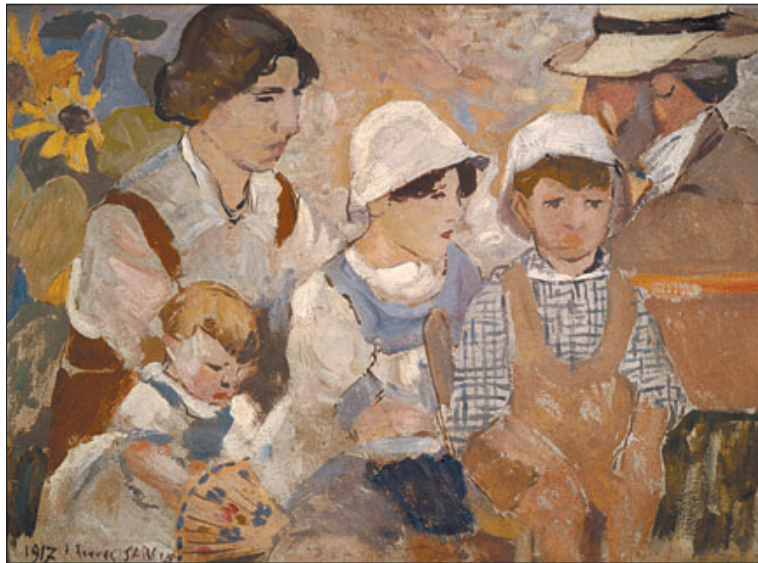
► Quadro de Joaquim Torres-Garcia titulat La familia .

FOTOGRAFIA I MÚSICA // A més d'actriu de la seva factoria com Chus Lampreave, Kiti Manver i Rossy de Palma, Almodóvar compta amb dos mags de la imatge i el so. Al director de fotografia mexicà Rodrigo Prieto ( Babel i Brokeback Mountain ), «no he d'explicar-li», comenta el realitzador, «com vull que siguin els colors perquè per la nostra cultura tenim molt en comú». De Prieto, li agrada la imatge naturalista que imprimeix en les dues últimes pel·lícules d'Ang Lee. Amb el músic donostiarra Alberto Iglesias, candidat als últims Oscars per Cometas en el cielo , la sintonia és total després de 12 anys de col·laboració. ≡